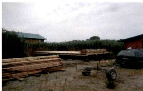
fotografija lokacije početkom avgusta 2020 godine

Nakon konstatovanja početka radova na navedenoj lokaciji početkom avgusta mjeseca 2020 godine, kada smo konstatovali izvođenje radova na postavljanju daščane platforme na drvenim šipovima površine cca. 60 m 2 , , prosljedili smo vam dana 10.08.2020 godine Zahtjev za kontrolu prostora broj 0103-96/34-1.